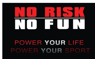
No Risk No Fun